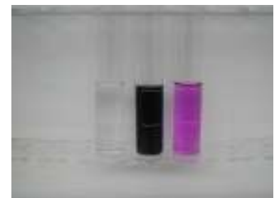
ブランク、染料未除去、染料除去

手袋用革、自動車シート革に含有する六価クロムの正確な評価対応が図れるようになりました。