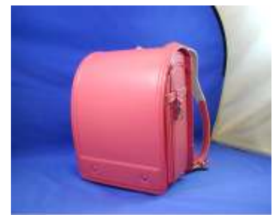
試作したタンニン革のランドセル