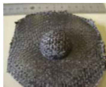
立体形状に成形した炭素繊維織物強化複合材料