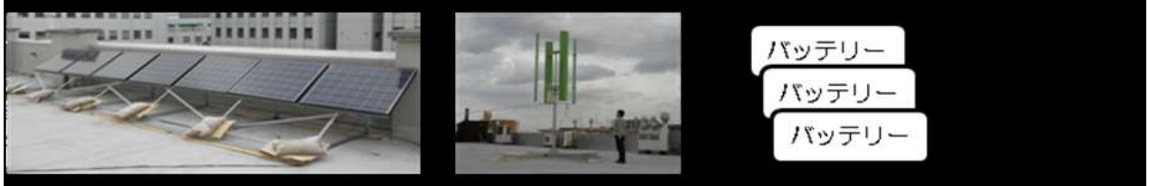
太陽光パネル、高効率・低騒音小型風力発電機とLiイオン電池を組み合わせるマイクログリッドシステム

本研究は、太陽光パネルや高効率・低騒音小型風力発電機等と蓄電池を組み合わせた網の目状の小型電源のネットワークを構築するための技術開発であり、このシステムの実用化は、自然エネルギー自給による低炭素社会づくりに大きく寄与することができ、また、災害時にも復旧の容易な小型自律分散型電源としての応用が期待されています。